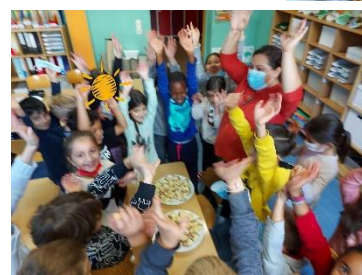
Die Klasse 2a freut sich über die leckeren Fußkekse.